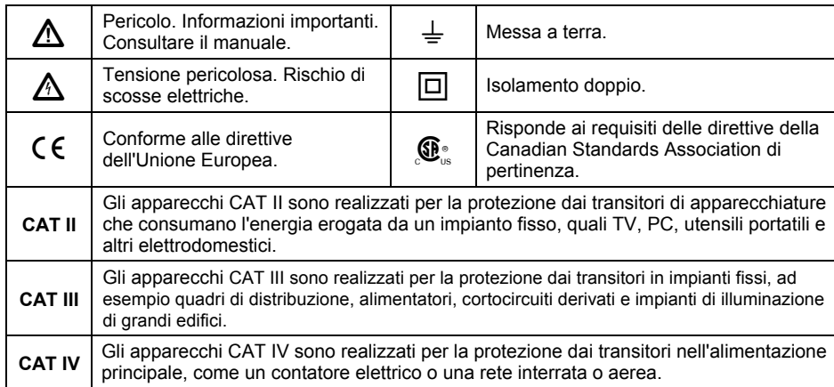
Tabella 1. Simboli

Sul 9040 e/o in questo manuale vengono usati i seguenti simboli.