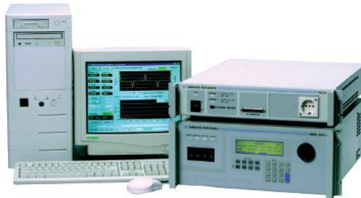
Figura 1. Un sistema CTS che comprende un sorgente di alimentazione AC, un PACS e un sistema di acquisizione dati basato su PC

Come mostrato in Figura 1 , la serie AMETEK Programmable Power CTS 3.2 è un sistema "chiavi in mano" per test di conformità per EN/IEC 61000-3-2, incluso A14, EN/IEC 61000-3-3 e differenti test di immunità EN/IEC 61000-4 AC.